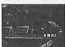
Den gamle brua.