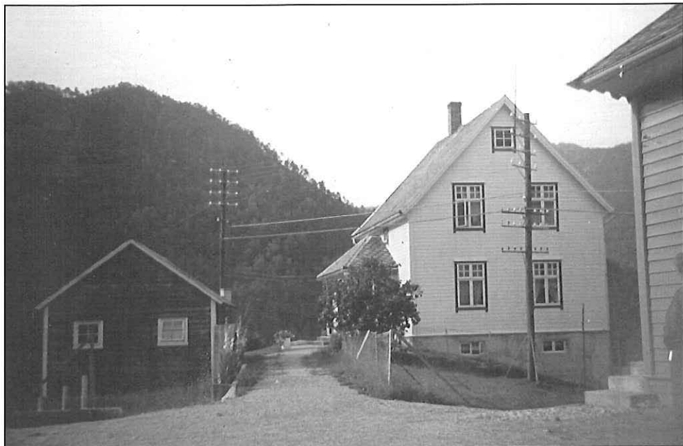
Telefonstasjonen på Stamnes